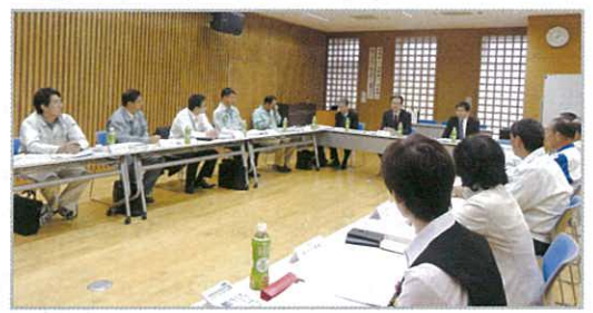
サプライズ講師として、磐田税務署長 松山 誠 様 から 法人税調査等のお話しを頂きました!!