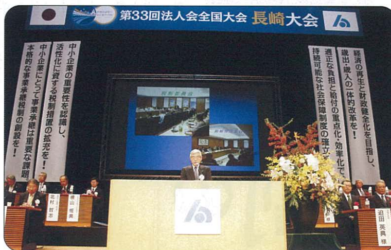
柳田税制税務委員長の提言報告