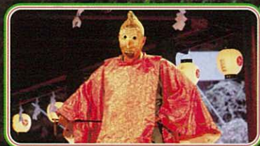
▲古式十二段舞楽 「陵王の舞」