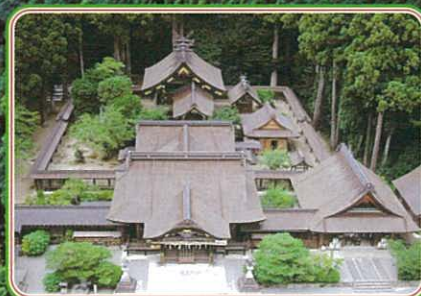
▲遠江国一宮 小国神社

「遠江国一宮」として現在も篤く崇敬される小国神社は、律令制における遠江國の国府と密接な関係を築いてきました。地方長官である「国司」が朝廷から国府に派遣され、国内の祭祀を司り、政治を治めていました。国司は赴任すると、国内の有力な神社を巡拝します。中でも、一番に赴任の奉告を行った神社を、「一宮」と称し、現在の静岡県西部、遠江國の一宮とされたのが小国神社でした。