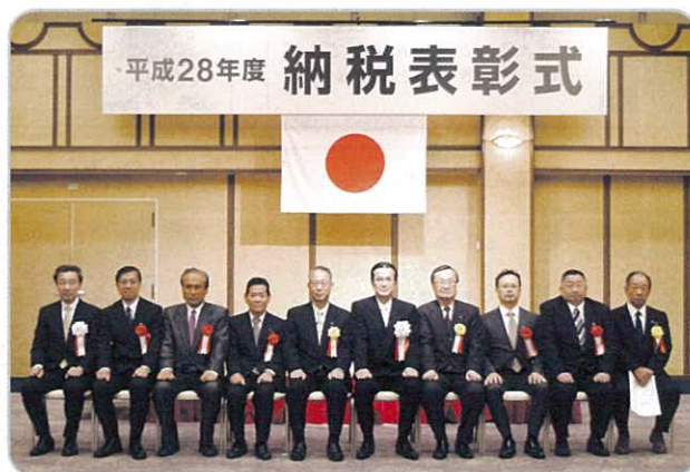
式典終了後、法人会のために記念撮影させていただきました。