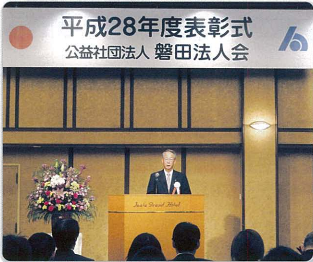
平成28年度表彰式 公益社団法人 磐田法人会